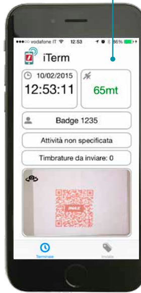
Registrazione presenze (tag NFC o codice QR)