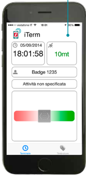
Indicazione tempi e attività